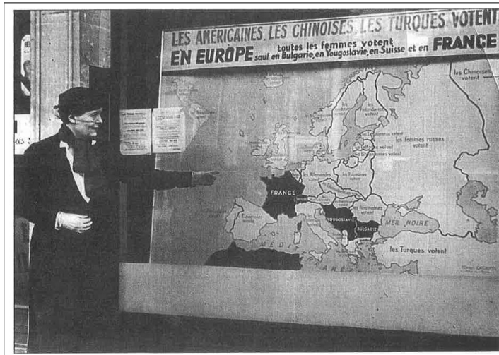
Louise Weiss commentant une carte de l'Europe en 1934.

Inscription sur la carte : « Les Américaines, les Chinoises, les Turques votent. En Europe toutes les femmes votent sauf en Bulgarie, en Yougoslavie, en Suisse et en France ».