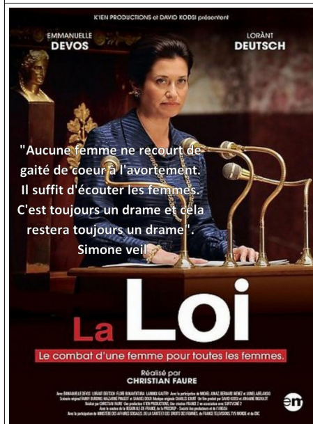
Doc 2. Téléfilm « LA LOI, le combat d'une femme pour toutes les femmes ».